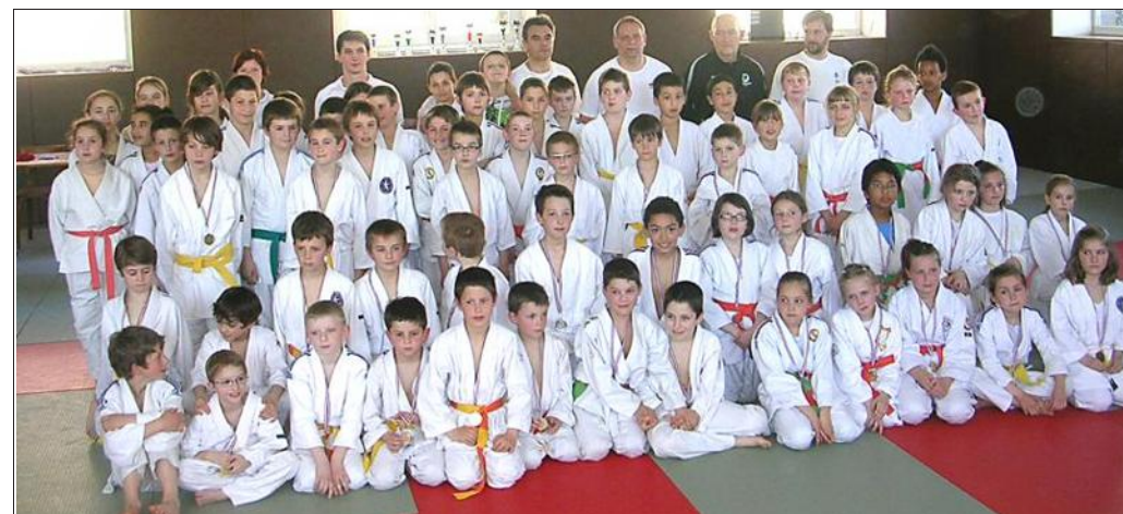
■ Les judokas ont engrangé beaucoup de médailles.

Le classement des clubs : 1 er La Vaudoise ; 2 e Saint- Germain ; 3 e Lure ; 4 e Cham- pagney ; 5 e Vy-lès-Lure ; 6 e Corre ; 7 e Dojo La Seve ; 8 e Francheville et 9 e Com- beaufontaine. Ronchamp étant hors classement.