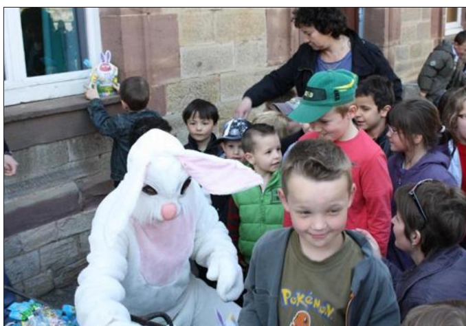
■ Les friandises en chocolat ont du succès.

Le lapin de Pâques est venu rendre visite aux enfants de l'école juste avant les vacan- ces. Cette sympathique ma- nifestation organisée par l'Amicale laïque a permis à